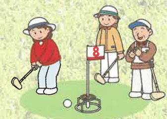
※各ホールのレイアウトは、定期的に変更になります。

初めての方も安心! 施設には、クラブ、ボールなどのレンタル品もあります。(有料) ご家族やお友達との手軽なスポーツ & レジャーとしてもご利用ください。