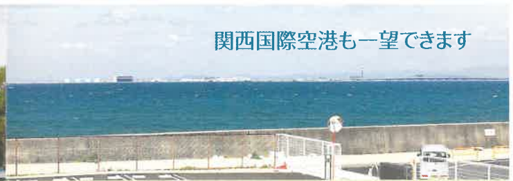
関西国際空港も一望できます