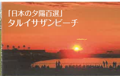
「日本の夕陽百選」 タリイサザンビーチ