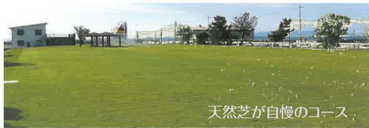
天然芝が自慢のコース