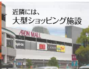
近隣には、 大型ショッピング施設