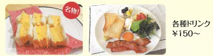
●フワフワだし巻きサンド ●モーニング一例

レストランコーナー 8:30~17:00 (L.O16:30 / 時間帯により提供内容が変わります)