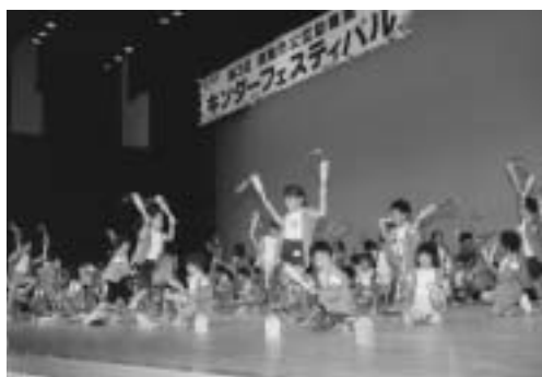
楽しく演技する園児たち

接、市民体育館へ。または、ハガキ(一枚で何人でも申込み可)に住所、氏名、性別、年齢、電話番号を明記の上、〒五九〇・〇五二一泉南市樽井二の二六の一・市民体育館へ▼問合せ 市民体育館