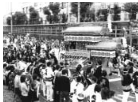
▲祭囃子が秋空に響きわたる..