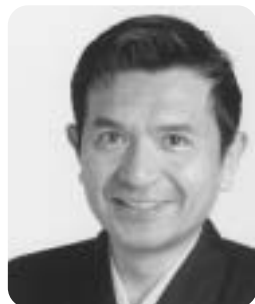
落語家 桂 小春団治さん