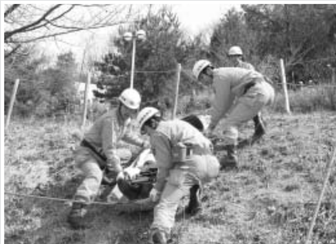
林野火災総合消防訓練（3月7日／青少年の森）

消防隊による消防訓練、煙体験、婦人防火クラブに後方支援（炊き出し）訓練、お茶会、ミニ消防自動車の展示等が行われました。