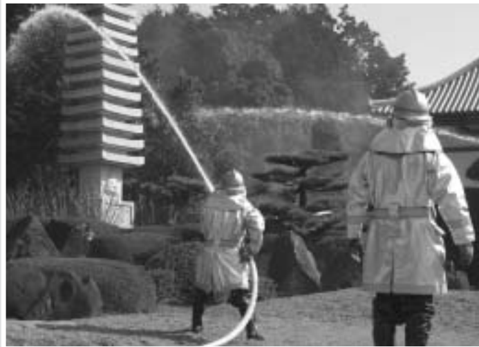
第2回消防フェア（2月28日／長慶寺）

泉南市消防本部では、春の火災予防運動（3月1日～3月7日）の一環として、2月28日(土)、信達市場の長慶寺で第2回消防フェア。続く3月7日(日)、新家の市立青少年の森において、林野火災総合消防訓練をそれぞれ開催しました。