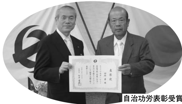
自治功勞表彰受賞者

生活困窮者の救済および生活指導等を行うとともに、社会福祉事業への積極的な参加協力など泉南市民生委員児童委員協議会の発展に尽力