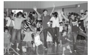
△昨年6月に行われた出前保育まつり

茶、着替え、敷物は各自ご持参ください▽午前8時30分現在、泉州地域に暴風警報が発令されている場合は中止します