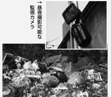
→昼夜撮影可能な監視カメラ

知らせてください。不法投棄の発生あるいは発見した日時、場所、投棄されたもの及びその量、さらには、投棄者、車両の車種・色・ナンバー等をお知らせください