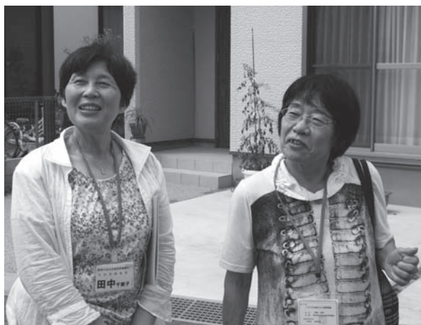
民生委員児童委員

以上のようなことを、訪問時に心がけています。訪問して数カ月もすると、子育てサロンや子育て支援のイベントに顔を出してくれませんが、その時の成長した子どもと笑顔の親御さんの姿に再会できることを楽しみに、また、訪問時に気になったことを相談機関等に伝え、親子にとつて良い結果が得られることを念頭に、こんにちは赤ちゃん訪問を行っています。