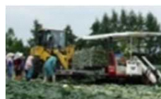
機械化体系の導入