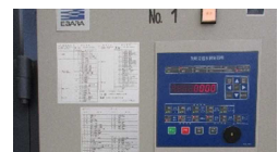
環境制御盤の導入