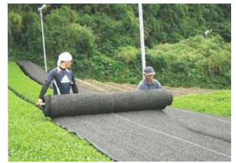
茶の被覆作業の実施