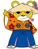
泉南市マスコットキャラクター せんなんくまじろう 「泉南熊寺郎」 “せんくま”