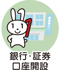
銀行・証券 口座開設