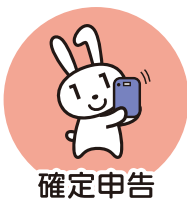
確定申告 (2024年度より)