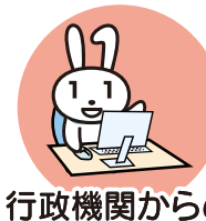
行政機関からの お知らせ・各種証明書