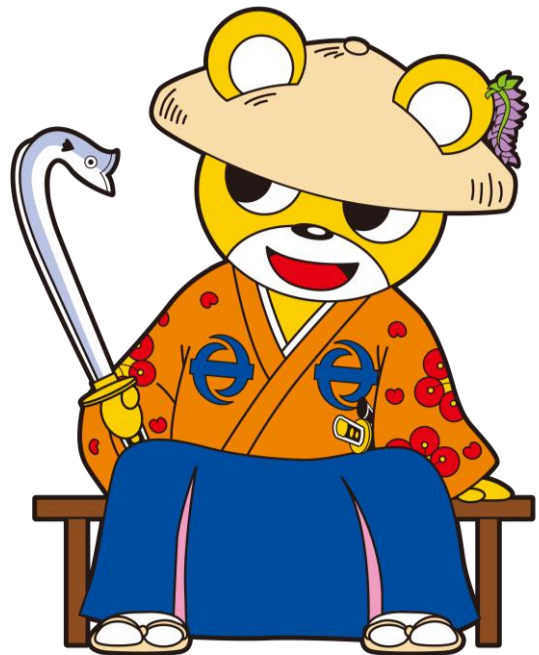
泉南市マスコットキャラクター せんなんくまじろう 「泉南熊寺郎」