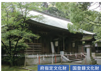
府指定文化財 国登録文化財