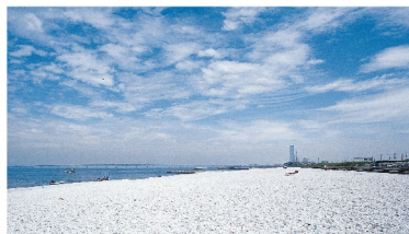
りんくうマーブルビーチ

泉南市の公共下水道事業30周年を記念し、2017年春にデザインしたマンホール蓋です。主役は、泉南市のマスコットキャラクター「泉南熊寺郎」。背景には、穏やかに広がる海のように平穏な生活が続いてほしいという願いを込め、幸福を呼び起こす吉祥模様の「青海波(せいがいは)」をデザインし、その周囲に泉南市の花「梅」をあしらいました。梅は別名を「好文木(こうぶんぼく)」といいます。これは、学問に親しめば立派な花が開くという言い伝えによるもので、次世代の成長・発展を象徴しています。そんな「幸多かれ」の願いが込められたマンホール蓋を、ぜひ探してみてください。