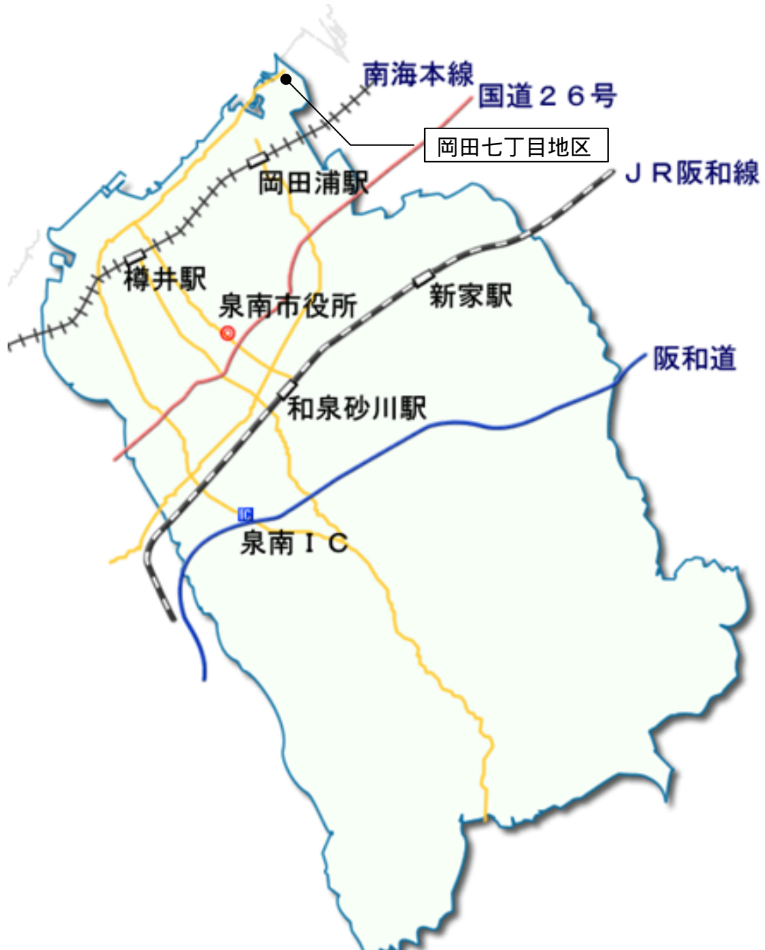
岡田七丁目地区地区計画位置図