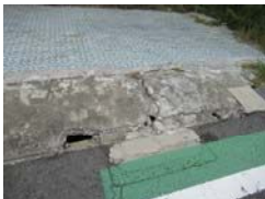
道路に穴が開いている