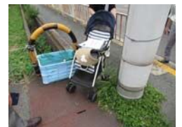
電柱が歩道の中心にあり雑草が生えていて通りにくい