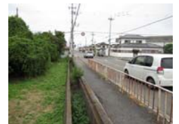
パン屋横の歩道の柵がさびて危険