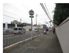
アスファルト舗装がないのでベビーカーが通行しにくい