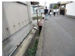
水路のフタがない