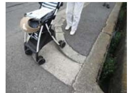
歩道に段差がありベビーカーが通行できない