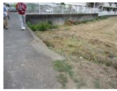
田畑と道路の境に柵などが無い