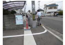
電柱が邪魔で通行しにくい