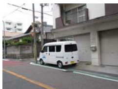
車が止まっていて見通しが悪い