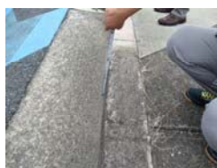
歩道と道路面との段差がきつすぎる