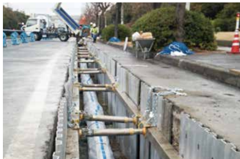
管路の更新・耐震化

地震などの災害に強い水道づくりや、安全でおいしい水道水の安定的・効率的な供給に力を入れています。