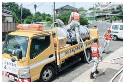
大規模災害時の相互応援（岡山県倉敷市真備町における給水活動）