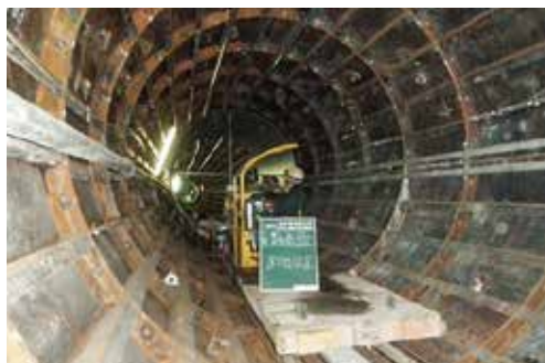
事故時におけるバックアップ機能の向上を目的とした、主要管路の二重化（バイパス送水管の整備）