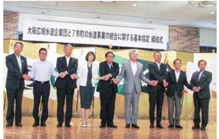
▲市町と企業団との基本協定書の締結(平成30年7月)

この度、泉南市・阪南市・豊能町・能勢町・忠岡町・田尻町・岬町と企業団は水道事業を統合することとなり、平成31年4月1日からは企業団が水道事業を行います。 (※能勢町においては、平成36年4月1日から水道事業を行います。)