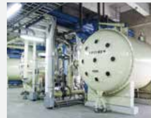
オゾン処理施設(かび臭などを分解)