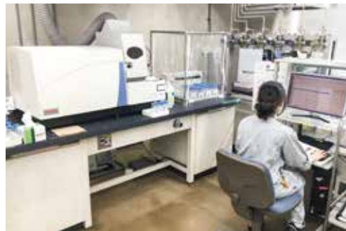
水質管理センター（専門職による水質管理・検査）