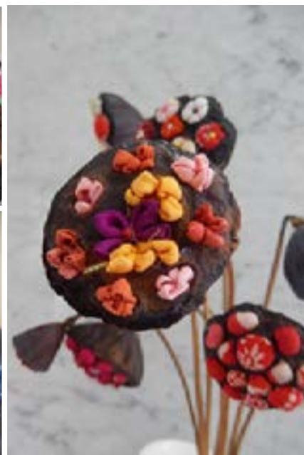
マンドリン・アンサンブル（左上）、司会進行するMさん（中上）、昨年花托で作った古布の小物（右）、お茶席で出されたお菓子（左下）、コーロ・ガティ（中下）