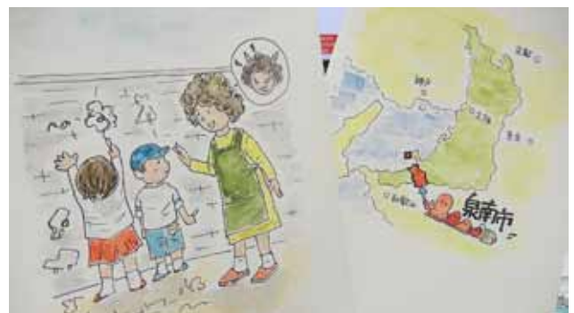
【絵札の絵が完成！】とてもかわいいオリジナルの絵も

最後に箱のデザインなのですが、事務局で案をつくってみることにします。ただし、基調となる色は水ナス色に決定。絵札、読み札、箱いずれも、水ナス色を使うことで、統一感を出したいとの皆さんの意見からです。