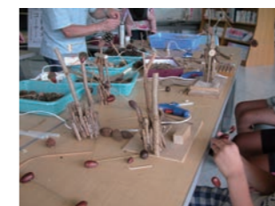
やじろべえ ドングリなどを使ってやじろべえを作ります。