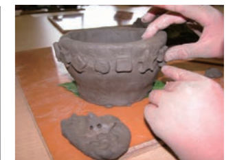
土器づくり 粘土を使って土器以外にもハニワなども作れます。