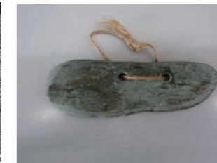
石包丁 緑泥片岩という石を磨いて、稲穂を刈り取る道具を作ります。