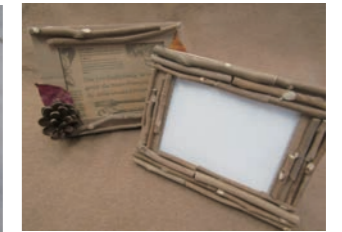
フォトフレーム どんぐりや小枝などでフレームを飾り付けます。