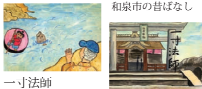
一寸法師 大阪市の昔ばなし