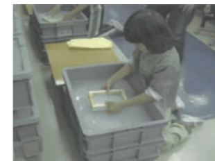
紙すき体験 牛乳パックを原料に、木枠で紙をすきます。