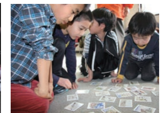
せんなんかるた かるたを使ってあそびながら泉南市のことが学習できます。