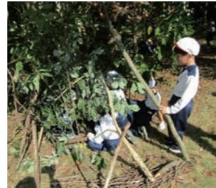
自然を活かした体験プログラムの例です。伐採した木の枝などで家を作ります。