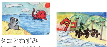
タコとねずみ トンガの昔ばなし

この他にも紙芝居はご用意しております。紙芝居一覧表は「普及活動案内」のサイトでご確認ください。右のQRコードからご覧になれます