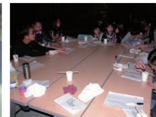
ロウソクづくり 型に流し込んだり、いろいろな方法で作ります。