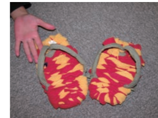
布ぞうり 古布を使ったぞうりづくり。リサイクルも兼ねています。