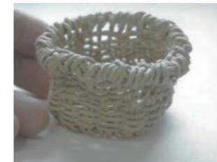
カゴづくり 鳥取県の遺跡で見つかったカゴと同じ編み方で作ります。