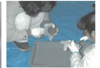
石器づくり サヌカイトという石を割って、ナイフなどを作ります。