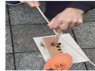
火おこし体験 木をこすり合わせて火をつけます。