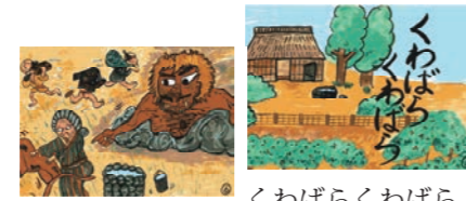
くわばらくわばら 和泉市の昔ばなし