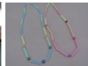
ストローネックレス ストローを使って古代のアクセサリーを作ります。