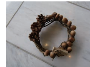
リースづくり ツタでつくったリースを飾り付けます。