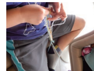
組みひもづくり 道具を使わずに作ります。