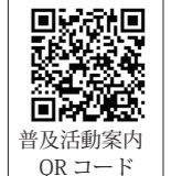
普及活動案内 QRコード

埋蔵文化財センターまでご相談ください。目的や日程に応じて、具体的なプログラムをご提案します。ご利用にあたっては『文化財普及啓発活動等利用申込書』にご記入の上、埋蔵文化財センターまでお持ちください。「普及活動案内」のサイトからダウンロードできます。