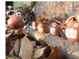
ドングリ人形 ドングリなどを使ったクラフトです。