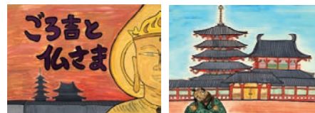
ごろ吉と仏さま 泉南市の昔ばなし