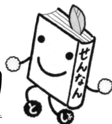
図書館のマスコット《とこしよ》