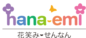
多色刷+背景：花笑みグラデーション